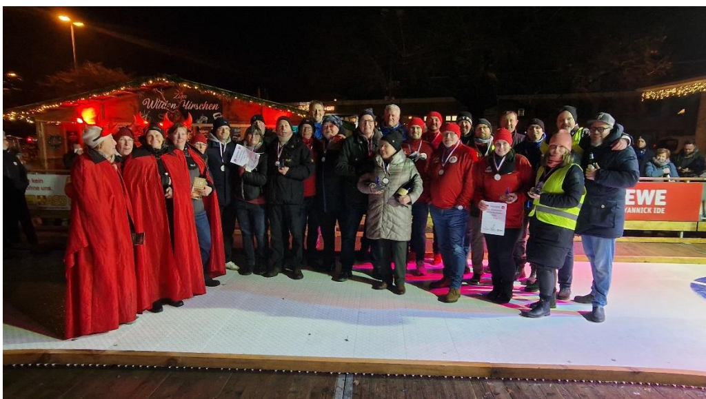
Die Finalteilnehmer des 14. Elmshorner Eisstockschießens 2022