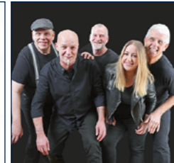
NOT NAKED by lisan GOIL | Pressefoto