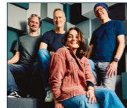
KIBEK | Violet Way