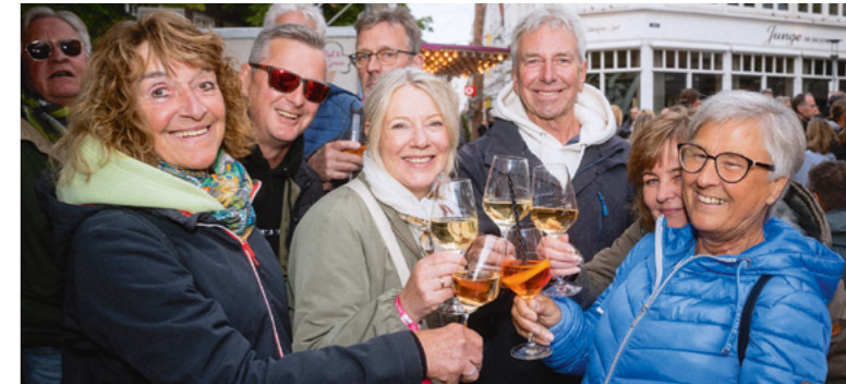
Wein- und Schlemmerfest