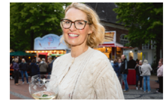
Weinkönigin 2025