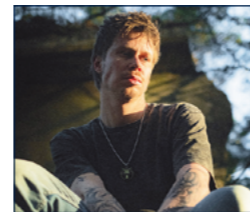
KIBEK | Tom Klose | © Heiko Ritt