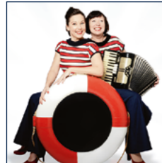
KLOSTERSANDE Ladies AHOI! | Pressefoto

Spielzeiten 19.30 bis 22.30 Uhr beinhalten flexible Pausen der Musiker.