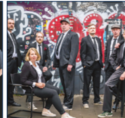
Musik Hofer Surfits | Pressefoto