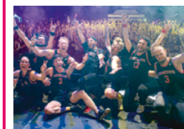
Tag der Helden

Wenn ein Raum voll erwachsener Kinder einen ganzen Abend lang sämtliche Cartoon-Introsongs der 80er, 90er und 2000er Jahre in den Raum brüllt, kann das nur eins bedeuten: Tag der Helden ist am Start! Eine siebenköpfige Rockband, die eine energiegeladene