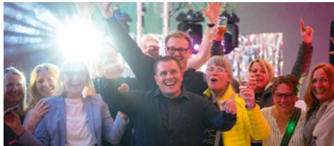
DJ Lasse Pippig Musiknacht 2025

Tickets sind von Umtausch oder Rückgabe ausgeschlossen.